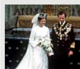
Fyra år efter "klicket" stod bröllopet.